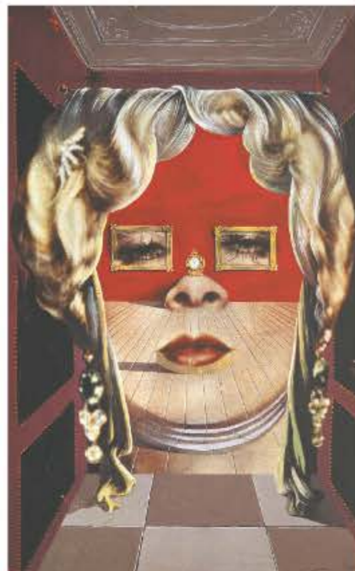
Salvador Dalí, Mae West – 1935.