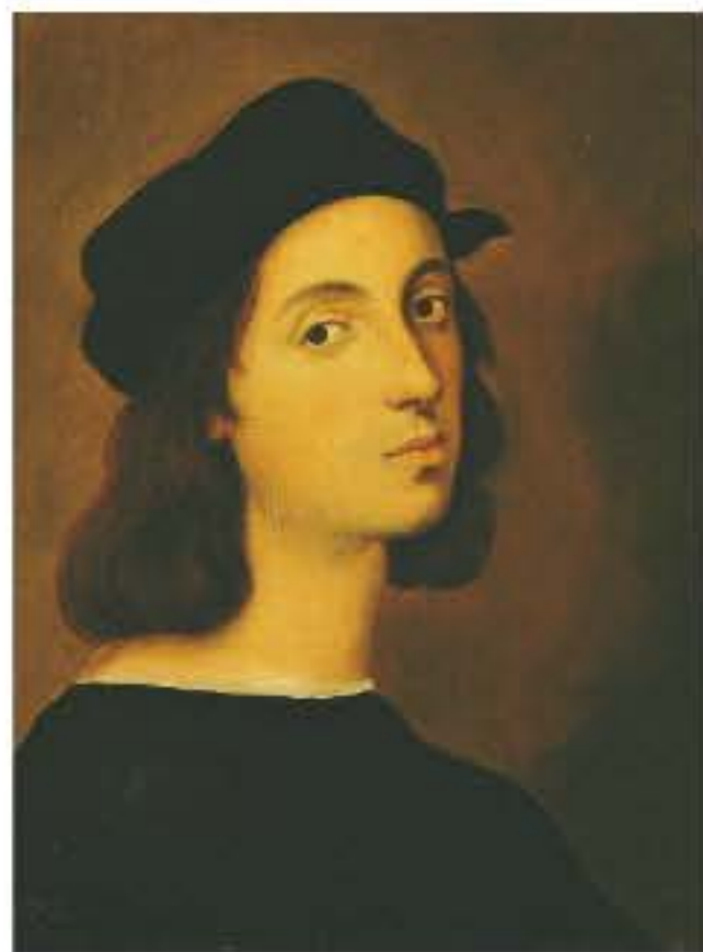
Raphaël, Autoportrait – 1504-1506.