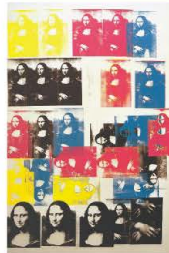
Andy Warhol, Mona Lisa – 1963.