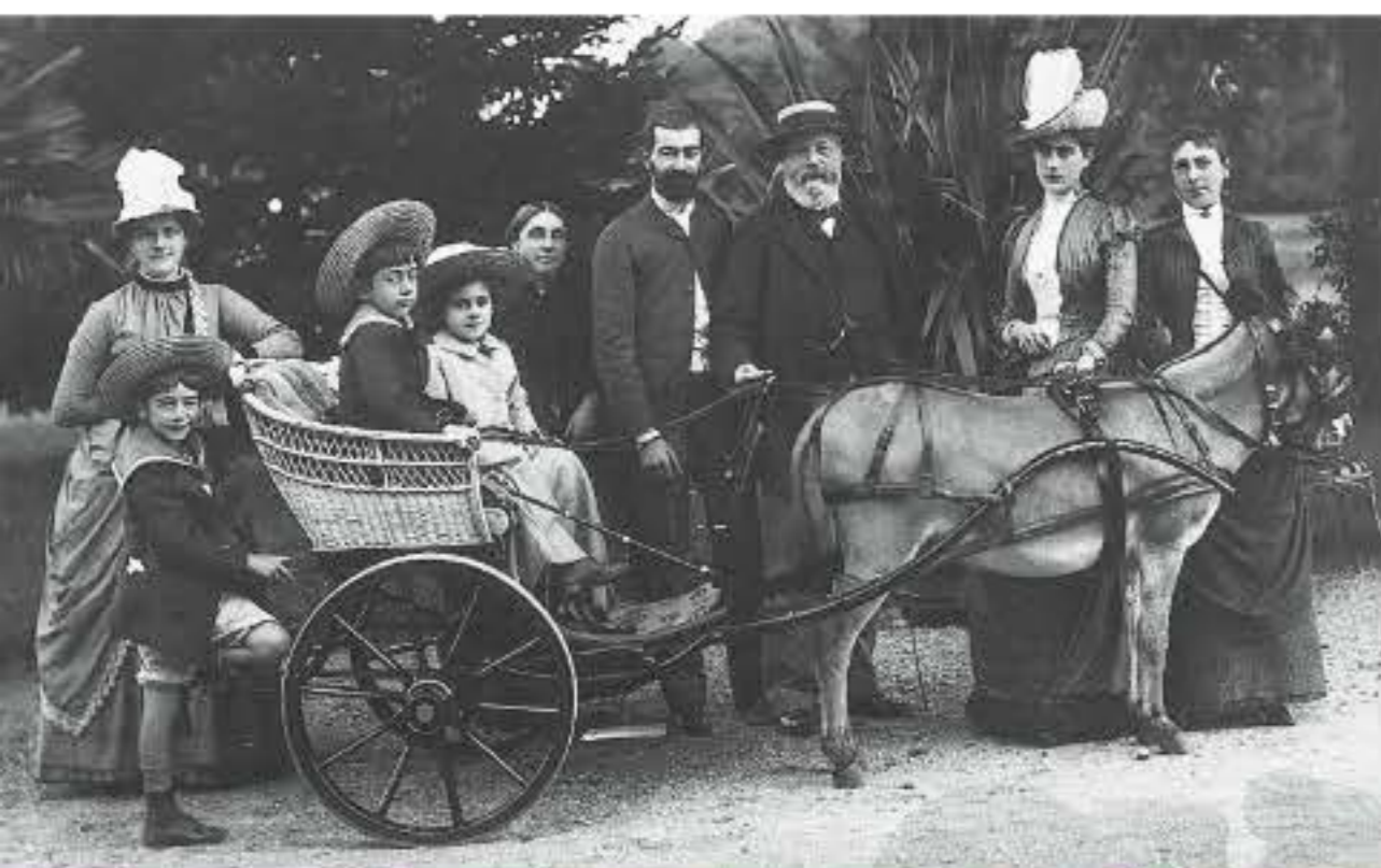
Nadar, La Famille Pereire – XIX e siècle.