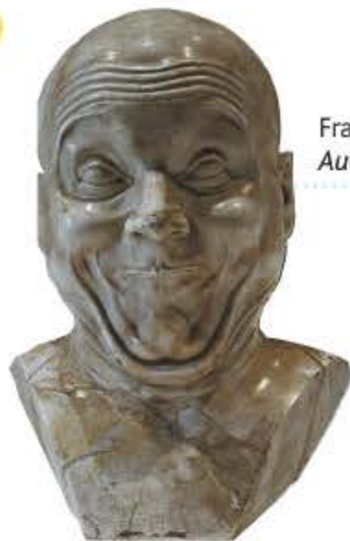
Franz Xaver Messerschmidt, Autoportrait en bouffon – 1770.